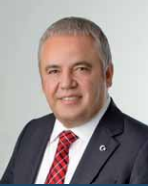
Muhittin Böcek Konyaaltı Belediye Başkanı Akdeniz Belediyeler Birliđi Başkanı

Ü lkemizin şehirleşme oranı yükselmiş, bütün kalkınma dinamikleri şehirlerde yoğunlaşmış bulunmaktadır.