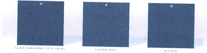
Grafik 1: AKBBB Personel İstihdam Durumu

Birliğimizde 2017 yılı itibarıyla toplam 6 personel görev yapmaktadır. Bunların; 2'si tam zamanlı sözleşmeli ve 2'si daimi işçi ve 2 personel de diğer statüde olmak üzere istihdam edilmektedir.